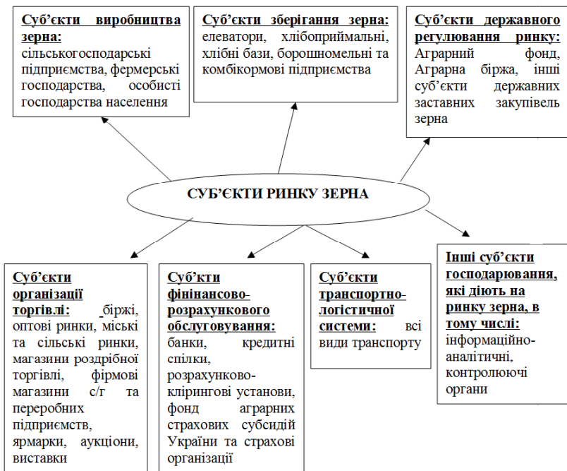
Рис. 1. Суб'єкти ринку зерна України*