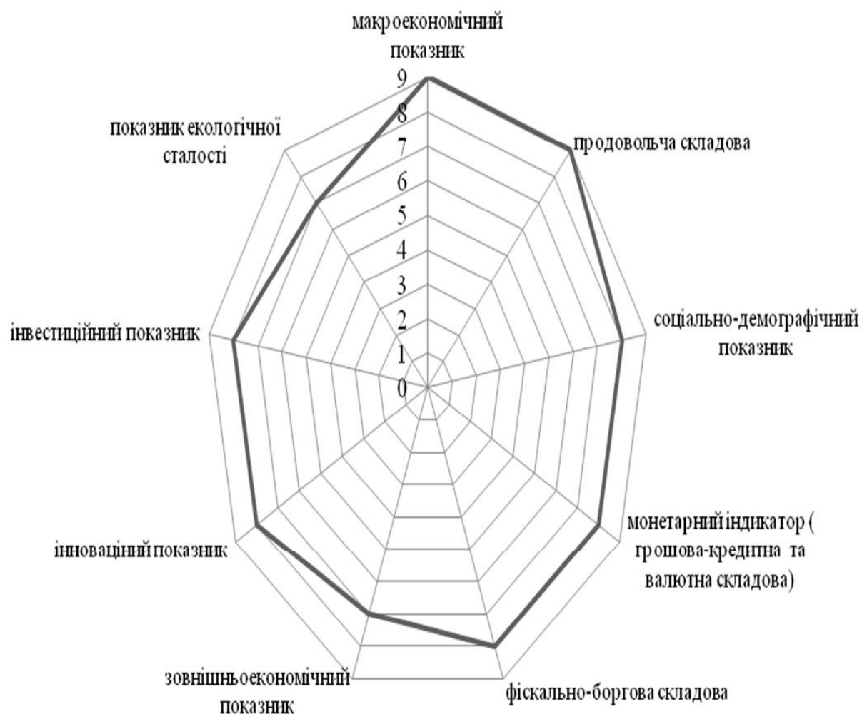
Рис. 1. Питома вага чинників впливу на рівень економічної безпеки держави за результатами експертної оцінки

показник, інноваційний показник, інвестиційний показник, показник екологічної сталості (рис. 1).