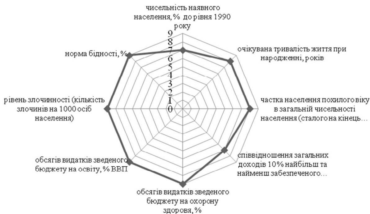
Рис. 3. Питома вага впливу соціально-демографічного показника на рівень економічної безпеки держави за результатами експертної оцінки

Вагомим є вплив соціальних критеріїв впливу, у тому числі через тісний зв'язок із демографічною ситуацією в країні та окремих її регіонах. Пріоритетними критеріями впливу на економічну безпеку держави у зв'язку із соціально-демографічними показниками є: обсяг видатків зведеного бюджету на охорону здоров'я та освіту, рівень злочинності, норма бідності, які становлять 60,0% впливу. Окремо виділено зв'язок соціально-демографічного показника із темпами поширення важких та соціальних хвороб, а також швидкість діагностування й попередження важких хвороб, у тому числі серед дітей (рис. 3). Експертами обумовлено, що недостатність діагностування важких хвороб на ранніх стадіях, поширення соціальних хвороб серед населення загострює демографічну ситуацію, виступає основною передумовою старіння населення.